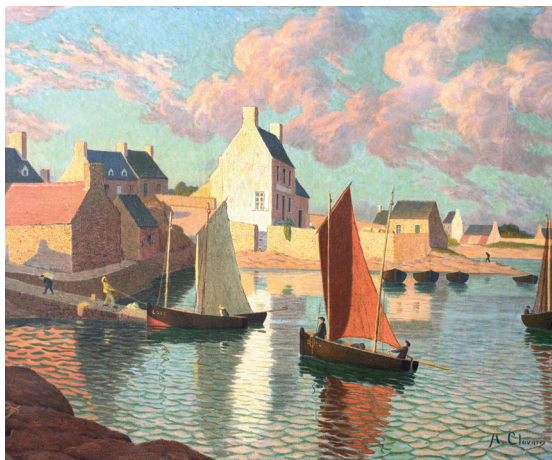
Albert CLOUARD, Le port de Ploumanach , huile sur toile 59x81cm (détail) collection particulière